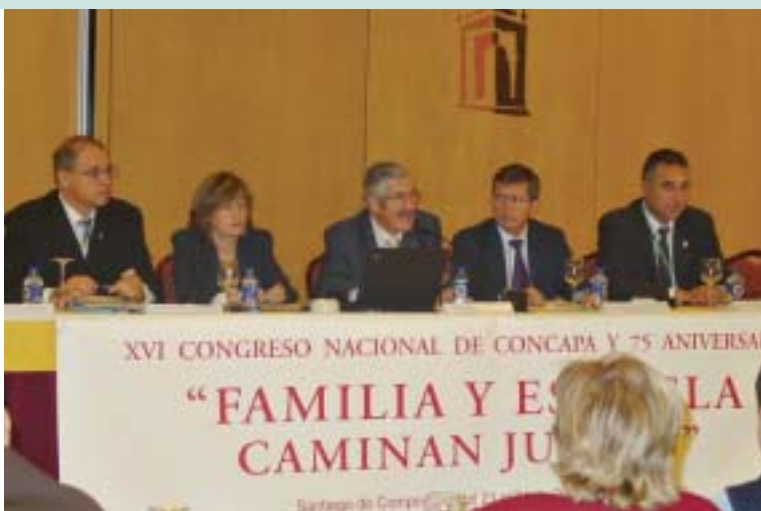
Un momento del congreso.

Tras una introducción en la que se dio un repaso de la consideración actual de la familia y su situación en el ordenamiento jurídico, en la primera ponencia hicieron un estudio de su evolución a lo largo del tiempo y en especial a lo largo del último tercio del siglo XX. La mayor influencia para este cambio fue la entrada de la mujer en el mundo laboral, por lo que se produce un reparto de roles entre el hombre y la mujer.